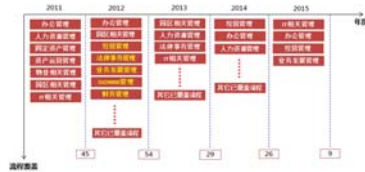
图表有效流程E化数量年份分布图